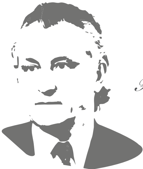
Федор Андреевич Сербиненко 1928-2002 г.

Эндоваскулярная нейрохирургия — "Узел достойный развязывания"